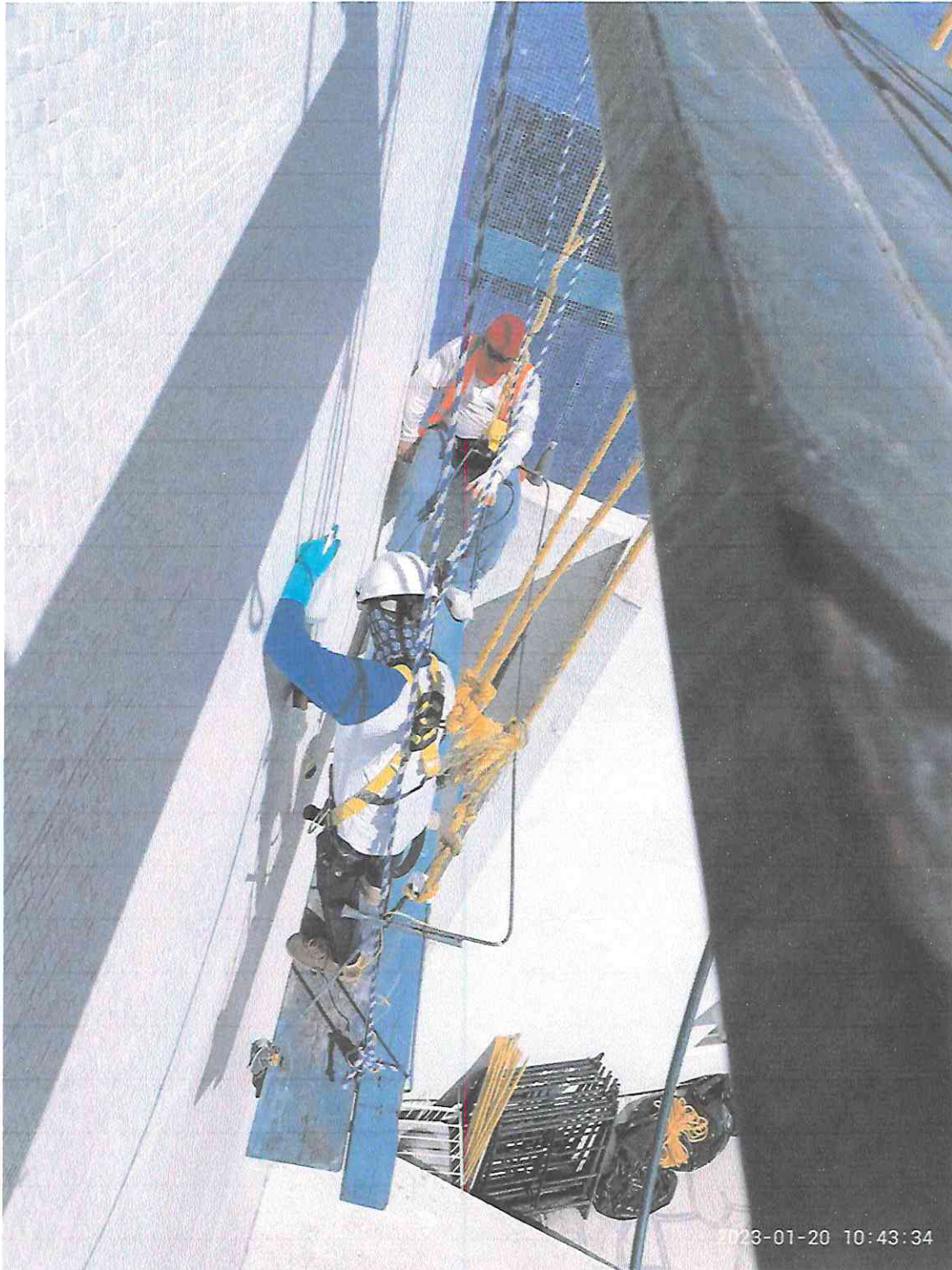
Armado de andamios Desinfección de teselas en el sector B2.