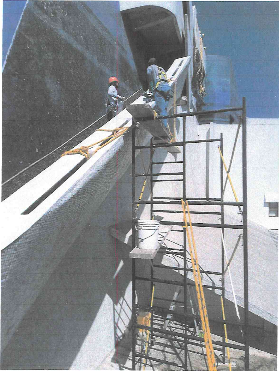
Armado de andamios y preparación del área la para limpieza en el sector B2.