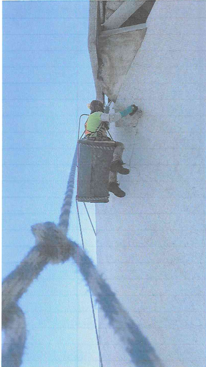
Limpieza de la tesela blanca con anti sarro en el sector B2